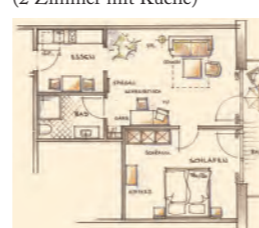
himmelsGlück – Suite Typ 27 mit Balkon im 2. OG – 50 m 2 (2 Zimmer mit Küche)