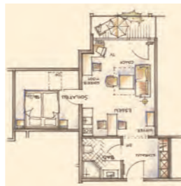
sternenHimmel – Suite Typ 26 mit Balkon im 2. OG – 44 m 2 (2 Zimmer mit Küche)