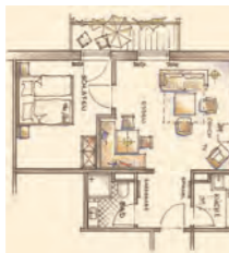
abendRuhe – Suite Typ 23 mit Balkon im 2. OG – 44 m 2 (2 Zimmer mit Küche)