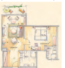
wolkenSpiel – Suite Typ 25 mit Balkon im 2. OG – 46 m 2 (2 Zimmer mit Kühlschrank, Tee- und Kaffeestation)