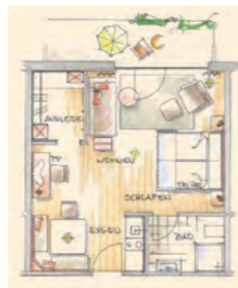
wiesenTraum – Suite Typ 11 mit Balkon im 1. OG – 37 m 2 (1 Zimmer mit Küche)