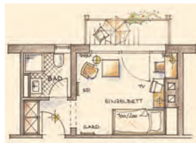
morgenSonne – Einzelzimmer mit Balkon oder morgenFreude – ohne Balkon – 19 m 2