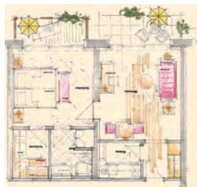
gartenGlück – Suite Typ 1 mit Balkon und Terrasse zum Garten – 50 m 2 (2 Zimmer mit Küche)